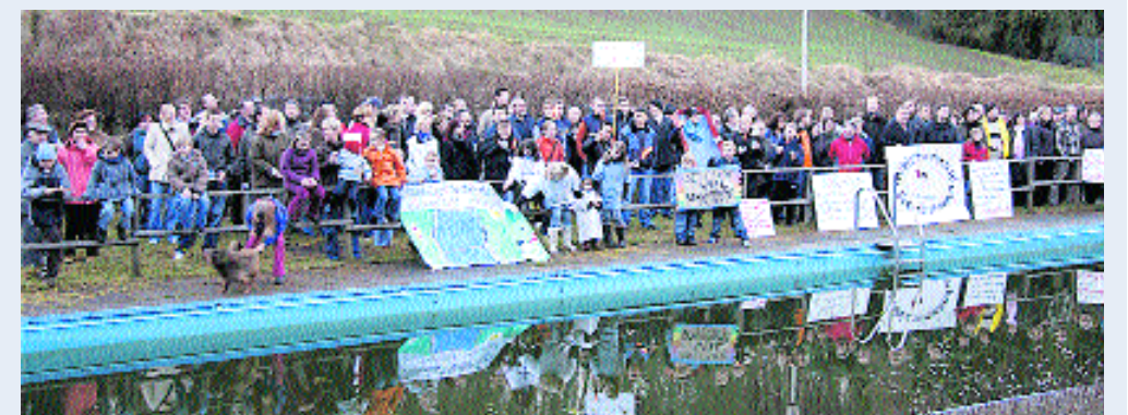
Freibad Dahlenrode soll saniert werden: Demonstration im vergangenen Jahr.

Der Ortsrat Dahlenrode befasst sich mit diesem und anderen Themen in seiner Sitzung am heutigen Montag um 20 Uhr im Dorfgemeinschaftshaus, Am Bad 2.